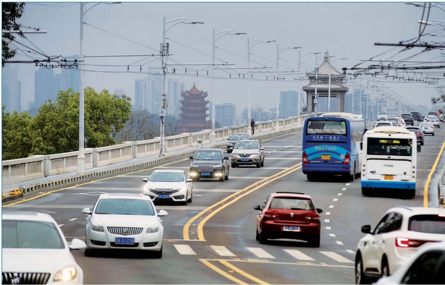
武汉正逐渐恢复“生活气息”

▲3月25日拍摄的武汉长江大桥上的车辆,随着疫情防控形势好转,武汉正逐渐恢复“生活气息”。